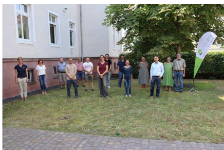
Titel: Mitglieder der Kooperation BioHeumilch Rhön-Vogelsberg

Das Vorhaben zielt auf den Aufbau einer vollständigen bio-regionalen Wertschöpfungskette, welche sowohl Verbraucherwünsche, als auch Belange des Natur- und Tierschutzes und insbesondere der Landwirte abdeckt.