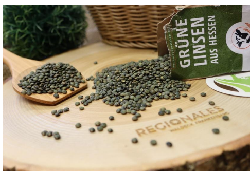
links: Linse © List; rechts: Linse © Wilke