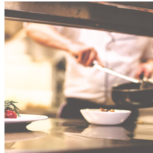
nearbuy / das Online Tool

möchte Lösungsansätze entlang der gesamten Wertschöpfungskette bieten.