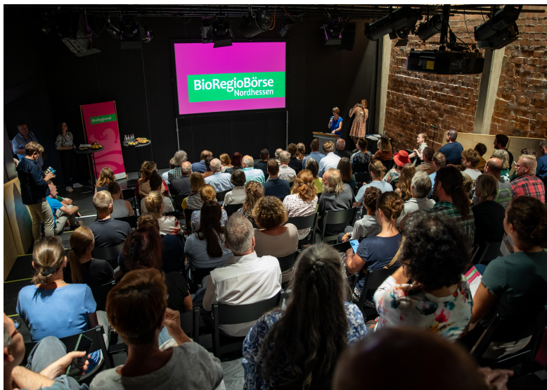
Publikum bei Eröffnungsrede

Um diesem Ziel näher zu kommen richteten die vier Ökomodell-Regionen Hersfeld-Rotenburg, Nordhessen, Schwalm-Eder und Waldeck-Frankenberg als Kooperationsprojekt am 12.09.2023 die BioRegioBörse Nordhessen 2023 in Kassel aus.