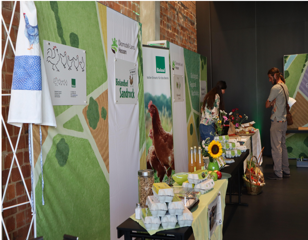
Stände von Ausstellern vor der Eröffnung