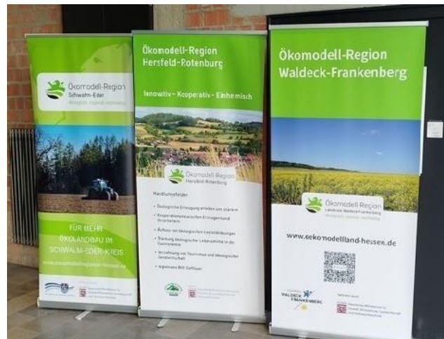
links: Foto des Rahmenprogramms, rechts: Rollups von drei teilnehmenden Ökomodell-Regionen im Eingangsbereich der UK14